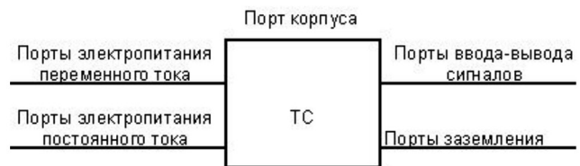
Рис. 3. Порты устройства

Часть внешних причин обусловлена поступлением на различные порты 1 (рис. 3) устройства электромагнитных помех, на которые оно реагирует так, как если бы было сформировано требование на срабатывание .